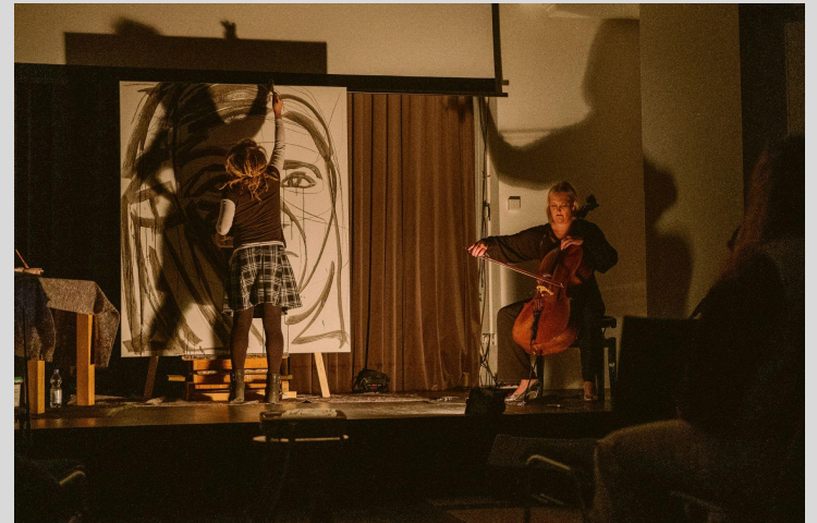
Link Ganze Auftaktveranstaltung "The Voice of Women mit Suraya Pakzad" am 11.10.22, im silent green in Berlin